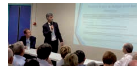
Citoyens, salariés et partenaires sociaux étaient présents en grand nombre à la consultation sur les ordonnances sociales fin septembre à Meudon.

La France a un besoin impératif d'avancer et de se réformer pour donner du travail au plus grand nombre. Nous avons mis en place, à un rythme parfois effréné, les éléments-clés du quinquennat : dynamiser le marché du travail et supprimer les freins à l'embauche ; recentrer les politiques sociales au service de ceux qui en ont le plus besoin (réforme des politiques du logement, de la formation professionnelle, de l'éducation) ; simplifier et alléger la charge administrative et fiscale ; relancer l'Europe qui protège.