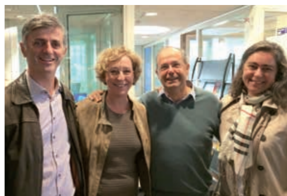
Soutien à Muriel Pénicaud, ministre du Travail, pour une réforme ambitieuse