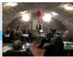
Consultation citoyenne sur le logement avec des associations de la circonscription