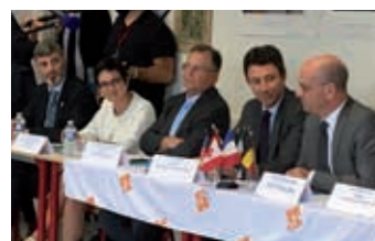
Rentrée scolaire au lycée de Sèvres avec les ministres Benjamin Griveaux et Jean-Michel Blanquer (Education Nationale), Dominique Fis (Directrice académique) et Pierre Soubelet (préfet des Hauts-de-Seine)