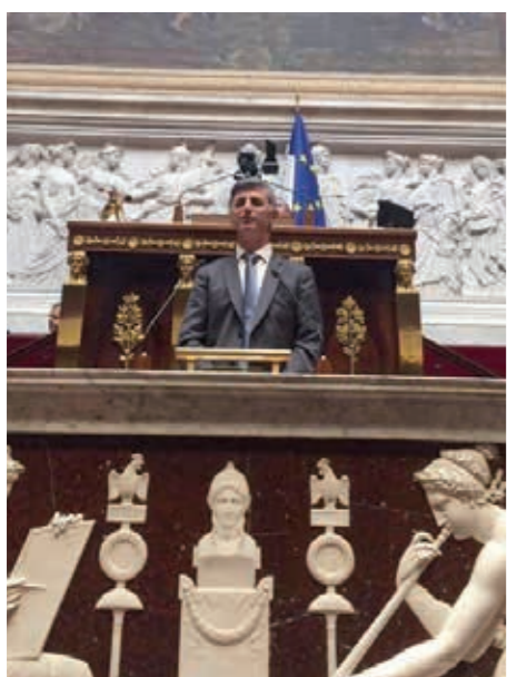
Intervention de Jacques Maire en séance à la tribune de l'Assemblée