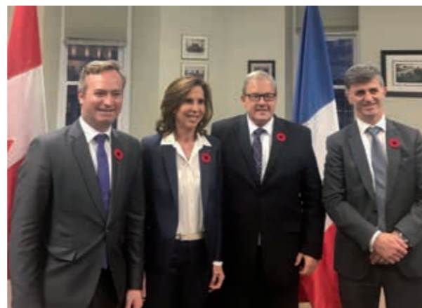
Rencontre avec le ministre canadien de l'Agriculture lors du déplacement officiel au Canada avec le secrétaire d'État Jean-Baptiste Lemoyne

Le CETA est entré en vigueur à titre provisoire le 21 septembre. Jacques Maire a réuni les membres de la majorité pour adresser 28 recommandations sur les questions sanitaires, environnementale et climatiques. Le gouvernement les a intégré dans son plan d'action le 25 octobre.