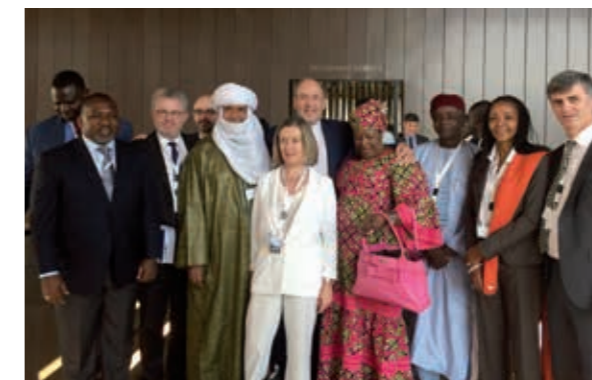
Rencontre avec des parlementaires africains